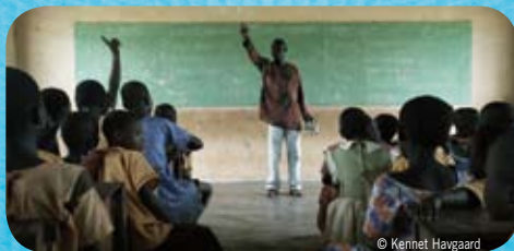
Escuela de la cooperativa Kuapa Kokoo en Ghana, construida con el apoyo de la prima FAIRTRADE-Comercio Justo